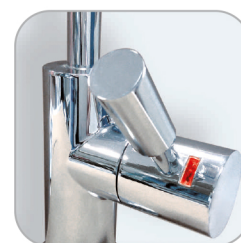
PIROS: SZŰRŐ CSERE