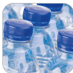
CSÖKKEN A MŰANYAG HULLADÉK